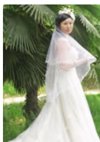
桐心化妆作品展示